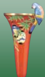
Vase: Porcelain H. 8.3in. 1918 ~ 1930