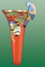
Vase: Porcelain H.8.3in. 1918~1930