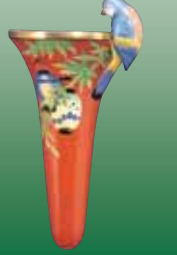
Vase :Porcelain H.8.3in. 1918~1930