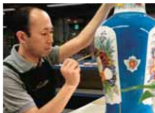
그림 넣기 공장 숙련된 기술자에 의한 정교한 소묘·전사 그림 넣기·금테 두르기 등의 그림 넣기 작업을 견학하실 수 있습니다.