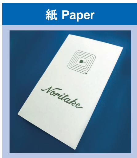
日本製紙(株)様 ご協力「ミラルパ」