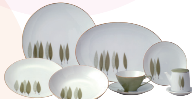
頒布会で販売された「若杉」 (1959年)

50年代半ば以降、日本国内の生活水準は高まり、ダイニングテーブルやキッチンなど、ライフスタイルの洋風化が進みました。ノリタケも生活様式の変化に合わせ、モダンで画柄のそろった国内向けの洋食器を展開、頒布会方式を採用して好評を得ました。