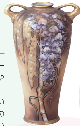
色絵金点盛藤文双耳花瓶 (1907年頃)