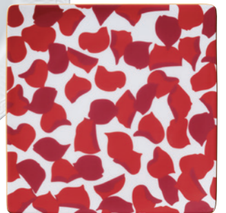
環境に配慮した赤絵具を開発 「ローザロッサ」 (2017年)