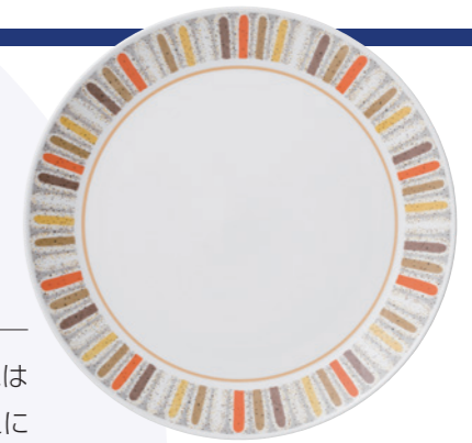
フリーザーから直火でも使える 「マルディグラ」 (1968年)

人々のライフスタイルが多様化し、モノを多く持つことよりも、家族や友人と豊かな時間を過ごすといった、コトが重視されるようになりました。食器には、シーンや料理のジャンルを選ばない使いやすさや、電子レンジ・食洗器に使えるなどの機能性の高さに、価値が求められるようになっていきました。ノリタケも、シンプルでスタイリッシュなデザインや、独特の風合いを再現した商品企画に力を入れ、器の形状やレリーフにこだわった食器を誕生させました。近年では、電子レンジに使用できる金加飾や、環境に配慮した絵具の開発など、機能面や作業者に配慮した技術革新に取り組んでいます。