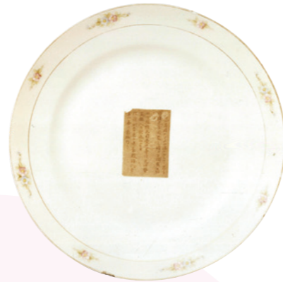
ディナー皿 [SEDAN] (1914年)