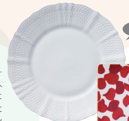
「シェール プラン」 (2011年)

アメリカ市場ではカジュアル化がさらに進んでいたものの、90年代半ば頃までは新婚祝い向けに、フォーマルなディナーセットの需要が残っていました。しかし、アジアの陶磁器メーカーのアメリカ市場進出や、バブル崩壊による国内の景気悪化により、ノリタケを取り巻く情勢は厳しくなっていました。そこで、付加価値の高い商品にラインアップを絞り込むとともに、インターネット販売や給食用などの販路開拓を行いました。