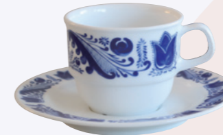
業務用に強度を高めた素材の食器 (1974年)