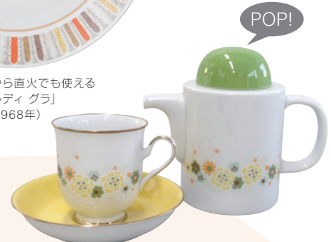
若者向けの商品として開発された ヤングメイトシリーズ (1972年)