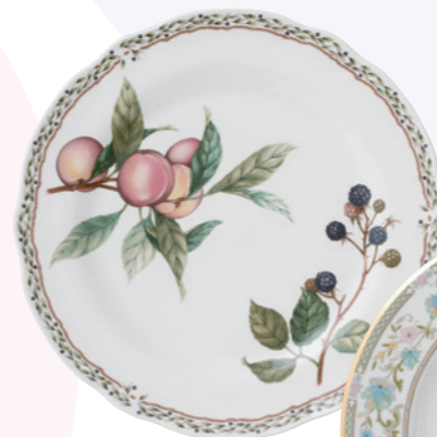
「ロイヤルオーチャード」 (1988年)

当時のノリタケのディナーセットを代表するスタイルとして、「三段貼り」が 高い評価を得たほか、現代にまで続くロングセラー製品も誕生しました。