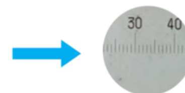
濾過後 After filtration

ボールベアリング超仕上(油性) (30μm/10目盛) Ball bearing superfinishing(Oil-based) (30μm/10 scale)